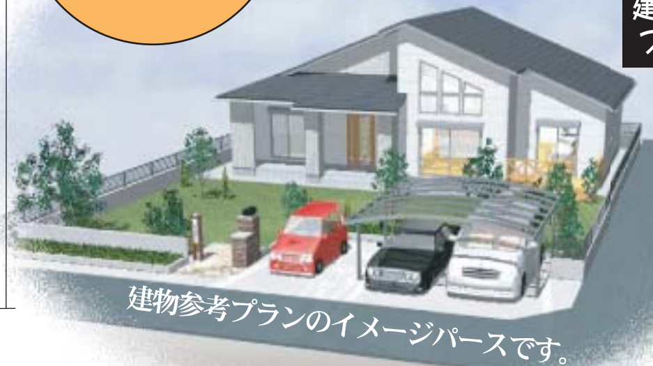
建物参考プランのイメージパースです。