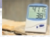
6月23日モデル屋外 13:40 41°C