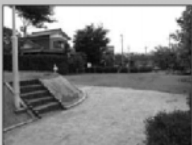
▲緑塚イベント公園